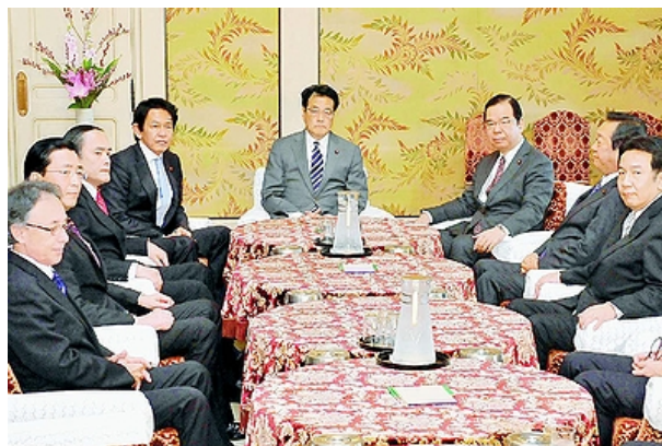
5野党党首会談に臨む（右2人目から左へ）生活・小沢一郎、共産・志位和夫、民主・岡田克也、維新・松野頼久、社民・吉田忠智の各氏＝19日、国会内（日本共産党のホームページより）