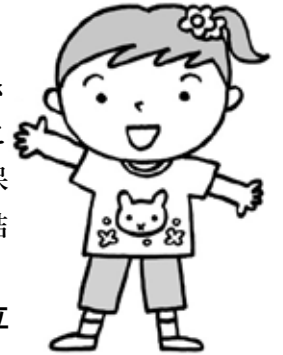
3歳以上の子ども 1人あたりの面積基準