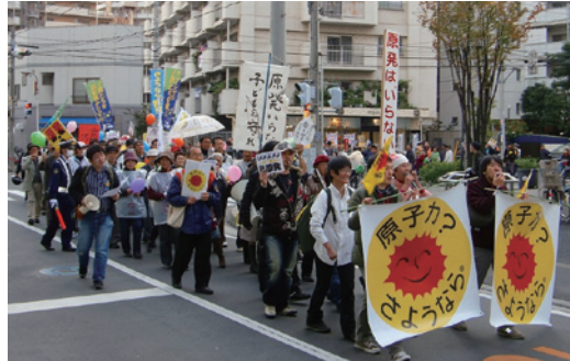
↑日本中で原発なくそうとデモが行われています。埼玉でも「原発なくそう@埼玉」デモが県内各地で毎回200人を越える老若男女の参加でとりまれています。上の写真は川口でのデモの様子です。

日本共産党は、人間社会と原発・放射能は共存できないと考えます。自然エネルギーの潜在量は日本の原発を全部合わせた40倍！だけどその1%も使っていません。自然エネルギーをイッキに増やし、5～10年かけて原発をゼロにすることを日本共産党はめざします。