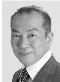
日本共産党埼玉県民運動委員長