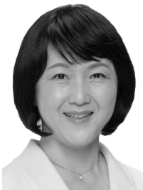
日本共産党前衆議院議員