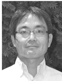
日本共産党埼玉県政策委員