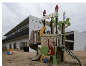
複合型子育て支援センター「パレットやぎさき」が2022年4月オープン

「子育ては最優先」「子どもの安全は第一」に、子ども医療費の無償化拡充、児童館建設など子育て環境の充実に力をつくしました。