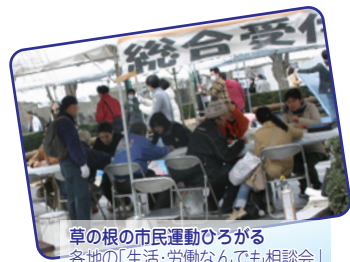
草の根の市民運動ひろがる各地「生活・労働なんでも相談会」(実行委員会など主催)

「派遣切り」にあった労働者が、直接雇用・正社員化をもとめ立ち上がっています。日本共産党はこのたたかいと結んで、大企業への速やかな是正指導と派遣法の抜本改正をもとめています。