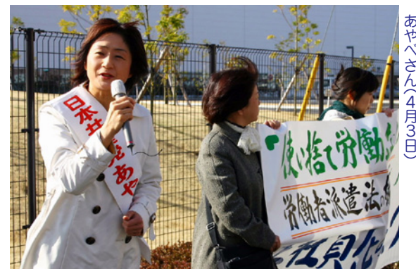
カルソニックカンセイ前で訴えるあやへさん(4月3日)